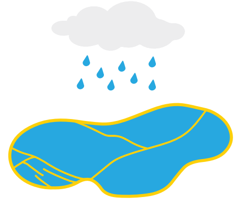
Terreros de Dispersión

El distrito municipal del Valle de San Gabriel transporta agua a la zona del Valle de San Gabriel