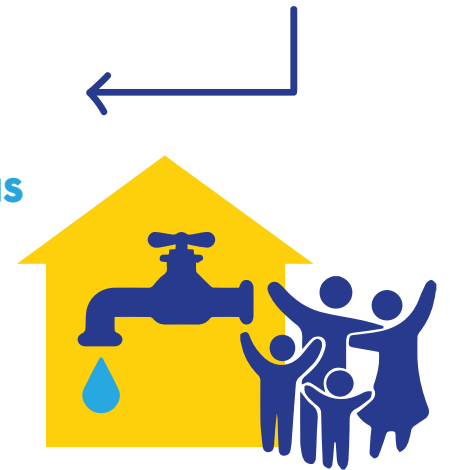
¡Así tenemos agua potable!

Nuestra responsabilidad es revisar las tuberías de agua en nuestros hogares y manejar el uso de agua.