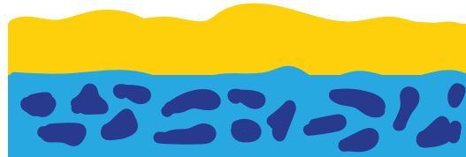
Cuenca de San Gabriel

El Departamento de obras públicas del condado de Los Ángeles supervisa el agua en los terrenos de dispersión que se agregan a nuestras reservas de agua subterránea.